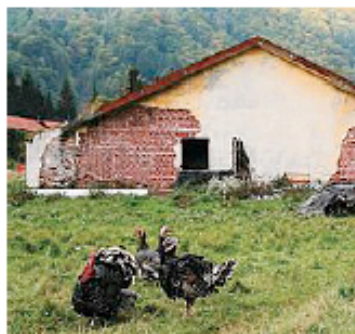
Tre immagini tratte dal documentario sulle caserme dismesse in Friuli